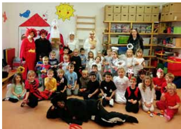
Mikuláš v MŠ Brandýský Matýsek