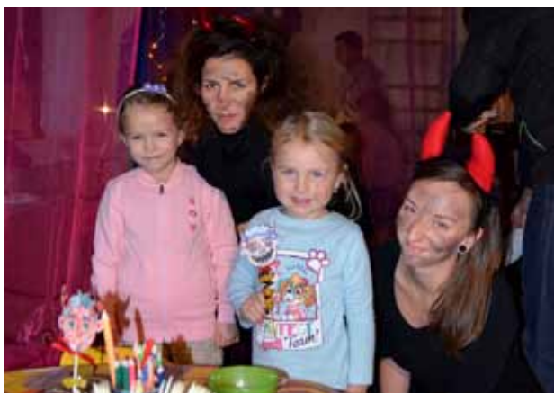
Cesta za Mikulášem