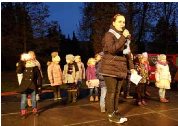
Svatomartinský lampiónový průvod