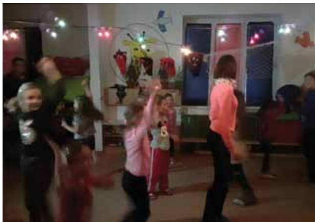
Cesta za Mikulášem