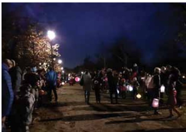
Svatomartinský lampiónový průvod